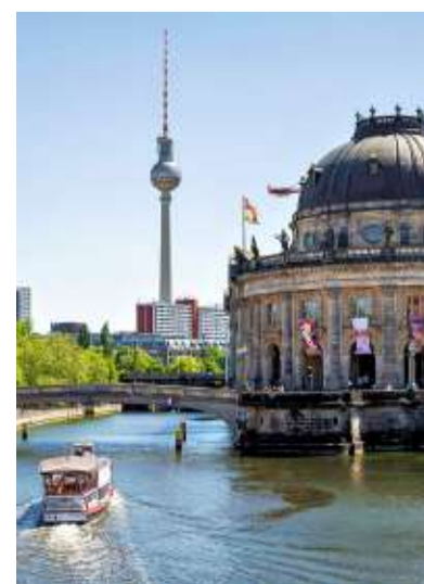
Bode-Museum in Berlin: Künftig mehr Schließzeiten

Von den aktuellen Plänen nicht betroffen sind etwa das Neue Museum mit der berühmten Büste